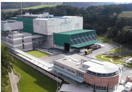
SAIDEF SA Rte de Châtillon 70 CH-1725 Posieux